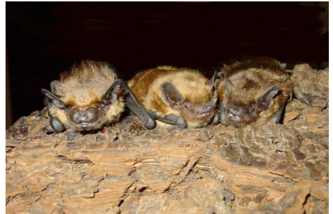
Die Fledermäuse Biene, Betty und Lucy (Renate Keil).

Natürlich waren wir auch 2014 jeden Tag für unsere Fledermauspatienten im Einsatz. 143 Tiere konnten gesund in die Freiheit entlassen werden. Einige Patienten haben uns leider zu spät erreicht und Hilfe war nicht mehr möglich. Bitte beachten Sie bei Fundtieren unbedingt unsere Informationen auf der Website. Dort haben wir auch viele andere interessante Informationen für Sie bereitgestellt.