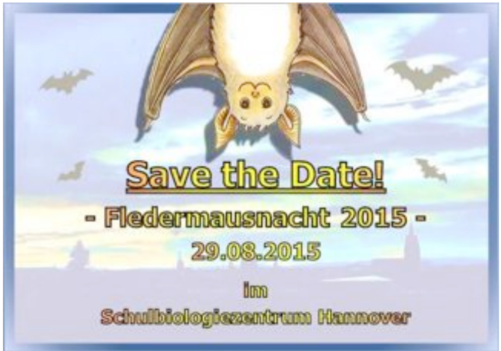
Einladung zur Fledermausnacht (Zeichnung: Carina Bach).

Sie haben unser Fest verpasst? Keine Sorge, wenn am 29.08.2015 in ganz Europa die Nacht der Fledermäuse gefeiert wird, werden auch die hannoverschen Fledermausfreunde mitfeiern können.