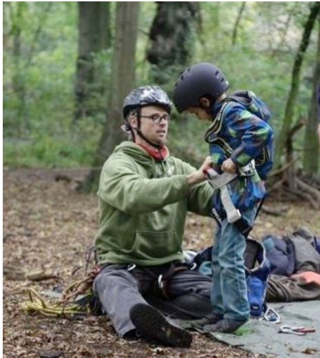
Ein Naturdetektiv macht sich fertig, einen Baum auf Höhlen zu untersuchen (Verena Stahnke).

2014 bot ein buntes Programm für die BUND-Naturdetektive. Dahinter verbergen sich naturinteressierte Kinder zwischen 6 und 10 Jahren, die eines gemeinsam haben: Sie sind neugierig! Mit Lili & Claudius haben sie vieles erforscht und (aus)probiert.