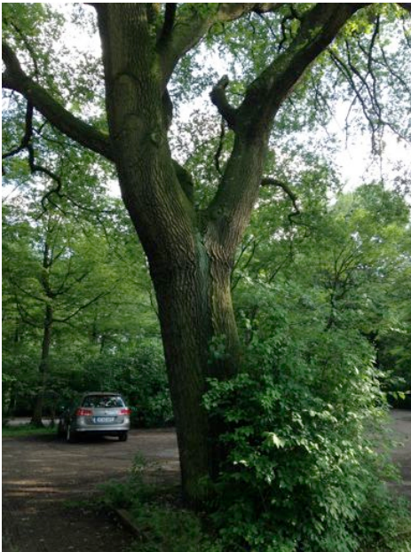
Alte Eiche wird erhalten (Armin Steiner).

Bei einer Prüfung der Beschlüsse des Rates der Landeshauptstadt Hannover auf mögliche Konflikte mit dem Naturschutz fiel der Arbeitsgruppe auch der Umbau des Eilenriedestadions auf: Dort soll auf einer großen, mit altem Baumbestand bestückten Fläche das neue Sport- und Leistungszentrum von Hannover 96 entstehen. Dabei wurde anhand der Planungsunterlagen deutlich, dass hierfür zahlreiche Bäume gefällt werden müssen.