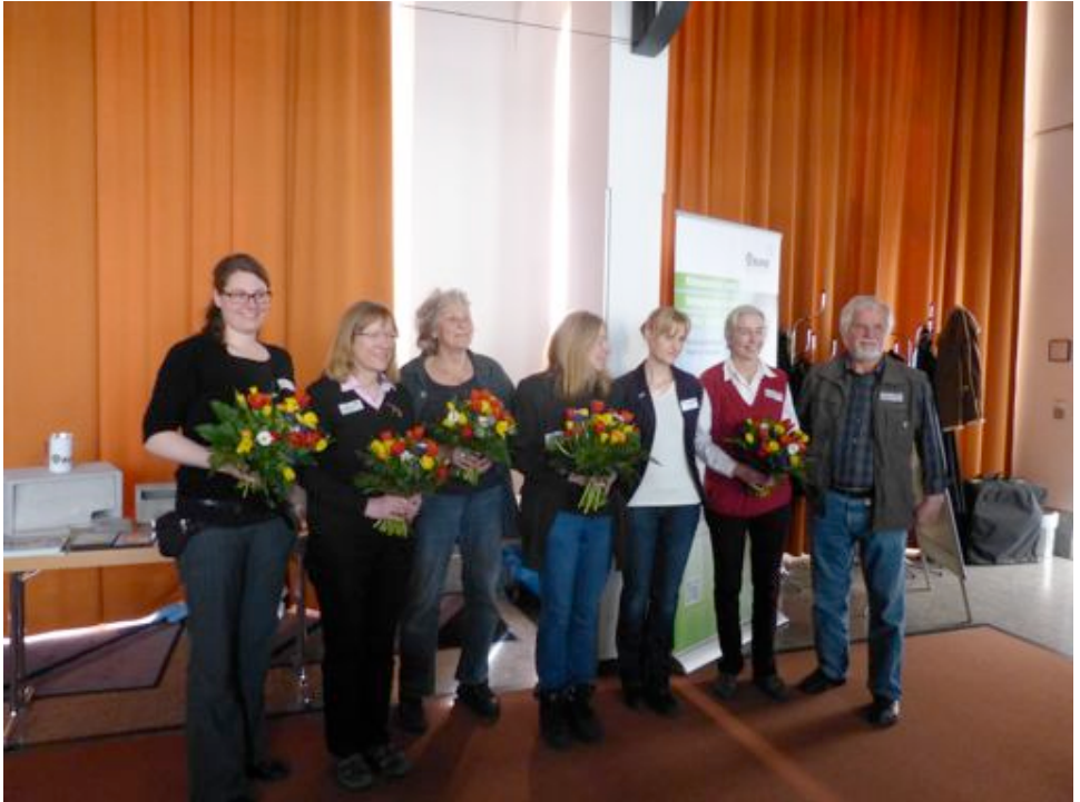
Auszeichnung der Arbeitsgruppe Mauersegler zum Jubiläum