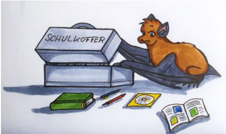
Schulkoffer zum Ausleihen.