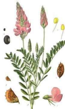
Pl. R. Sainfoin cultiv. Onobrychis sativa LINDL.

Inkarnatklee, Trifolium incarnatum (Hülsenfrüchtler). (siehe oben).