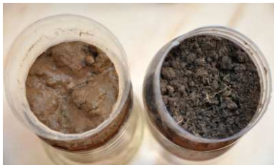
Foto Versickerungstest: verschlammter Ackerboden und krümeliger, humusreicher Boden im Vergleich.

Gründünger wird bereits heute vielfältig als Zwischenkultur genutzt, seltener hingegen als Untersaat oder in Mischkultur, obwohl er auch hier eine Schlüsselrolle zum Schutz von Kulturpflanze und Boden spielt. Gründünger fördert sehr schnell die Garenbildung des Acker- oder Gartenbodens, sodass Regen besser versickern kann und er vor Erosion durch Wind und Starkregen gut geschützt ist. In heißen Sommern helfen Gründünger-Untersaaten, die den Boden zwischen den Kulturpflanzen bedecken, Hitzestress und Austrocknung zu mildern zum Vorteil der hitzeempfindlichen, hilfreichen Bodenbakterien und Bodenpilze. Im Garten hat kontinuierliches Mulchen vergleichbare Effekte. Bei jährlicher Gründüngung wird außerdem der Humusaufbau und damit die Bodenfruchtbarkeit im Acker- oder Gartenboden gefördert.