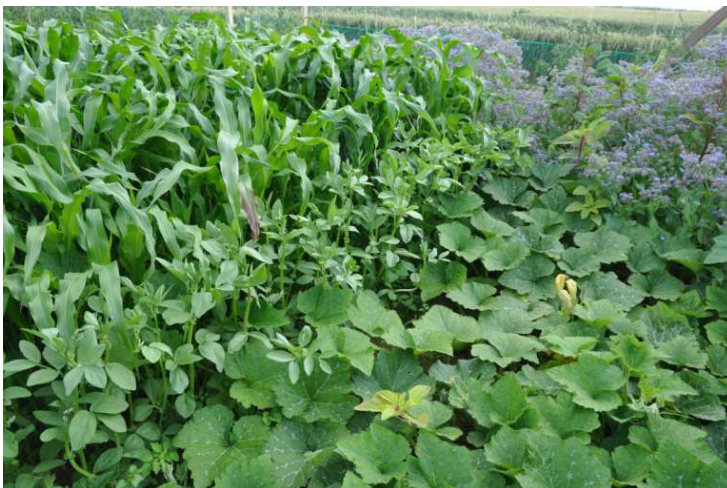
BUND Nutzpflanzenacker: In der Vegetationszeit immer bedeckter Boden durch Mischkultur, Untersaaten und Mulch; im Herbst durch Zwischensaat, die bei Frost abstirbt.

Doch vor allem profitiert vom Anbau vielfältiger Arten und deren Wurzelmasse das Bodenleben und damit die ungezählten Mikroorganismen, Bodenpilze und Kleinstlebewesen. So finden sich in einer Handvoll humusreichem Boden mehr Mikroorganismen, als es Menschen auf der Welt gibt. Die je nach Bodenart und Pflanzenart sehr unterschiedlich tief und in die Breite wachsenden Wurzeln der vielen Pflanzenarten im Gemenge durchdringen den Boden nicht nur in den obersten 20 Zentimetern, sondern können weit über zwei Meter Tiefe erreichen; so wird der Bodenraum optimal genutzt und belebt. Mineralien werden aus den übereinander liegenden Bodenhorizonten nach oben transportiert und sind für nachfolgende Kulturen verfügbar; die organische Masse im Boden nimmt kontinuierlich zu. Durch Frost absterbende oder auch winterharte Gründünger-Gemenge bedecken und schützen den Oberboden auch im Winter und bieten durch die organische Masse den zeitig im Frühjahr aktiven Bodenlebewesen Nahrung für einen guten Start in die nächste Vegetationsperiode.