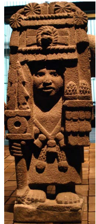
Links Keramik mit Mais (Argentinien, Museo de Ciencias Naturales de La Plata); rechts Maisgöttin Mesoamerika (Berlin, Ethnologisches Museum); Fotos SMW

der Götter an die Menschen hoch geschätzt, und im alten Maya Mythos Popol Vuh wird erzählt, dass die Götter die ersten Menschen aus Mais geformt und geschaffen haben. So hat die Milpa für die indigenen Kulturen zugleich eine spirituelle Bedeutung. Die Aussaat wurde und wird teilweise noch heute von Riten begleitet. Maiskolben werden den Naturgöttern geopfert; auch als Grabbeigaben spielten sie eine Rolle.