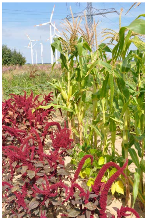
Hokkaido-Kürbis wächst durch Mais hindurch. Unten: Amaranth am Rand von Anzasi-Süßmais, dazwischen Körner-Buschbohnen.

Weitere Pflanzen in einer Milpa oder im an die Milpa angrenzenden Garten, die sich auch für die Kultur bei uns eignen, sind: Tomaten, Freiland-Chilis und Amaranth, um nur einige zu nennen. Tomaten und Chilis profitieren ebenfalls als stark zehrende Pflanzen von humusreichen Böden mit Terra Preta-Kompost. Chilis sind nicht nur Gewürz und Heilmittel, sondern wurden in einer indianischen Milpa auch zur Abwehr von Schädlingen und Krankheiten angebaut. Je nach Amaranth-Sorte können die jungen, zarten Blätter spinat-ähnlich genutzt werden.