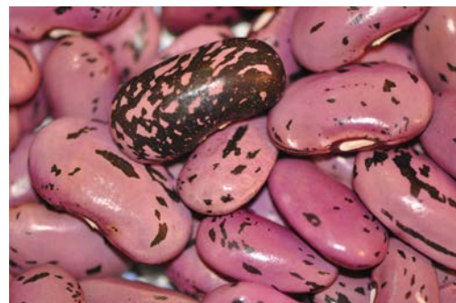
Käferbohnen getrocknet; Blüte einer brasilianischen Wildbohne, die zarte grüne Bohnen und kleine schwarze Körner hervorbringt.

ten Welt: Süßmais, Pop- und Mehlmals sind alle für den menschlichen Verzehr gut geeignet. Diese alten Sorten ebenso wie Maisbohnen haben auch in Europa eine lange Tradition und sind bei Biosaatgut-Produzenten, Vereinen oder privaten Saatgut-Erhaltern zu bekommen. Bei besonders kräftigen, hohen Maissorten können auch stärker wachsende Stangen- oder ausprobiert werden. Die getrockneten Körner der Feuerbohnen sind eine Delikatesse in der Steirischen Küche und dort als Käferbohnen bekannt. Aus der Cucurbita-Familie gibt es auch bei uns ein großes Angebot sehr wohlschmeckender kleinerer und größerer Bio-Kürbissorten und Zucchini; ein Riesenzentner sollte jedoch nicht in einer kleinen Milpa angebaut werden. Der Vorteil von Zucchini ist, dass sie am Rande der Milpa angebaut und dort fortlaufend leicht geerntet werden können.