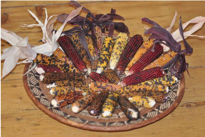
Indigene Maisvielfalt, die auch bei uns gut gedeiht: LongPopMix

Wenn wir dies auf unsere Verhältnisse übertragen, können wir Maisarten, die bei uns gut wachsen mit halbhoch rankenden europäischen Mais- oder indigenen Milpabohnen kombinieren. Es gibt für jeden Geschmack vielfältige Maissorten aus der Neuen und der Al-